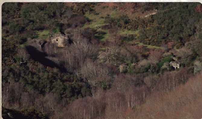
Aldea de Grobas

Entre piñeirais descubrirás as Neveiras e, a poucos metros, á Mámoa de Rofete, ambos os dous son bens etnográficos de grande interese arqueolóxico catalogados no Inventario Xeral do Patrimonio Cultural de Galicia. Outros dos lugares de interese que poderás visitar son o Muíño do Porto e as devesas.